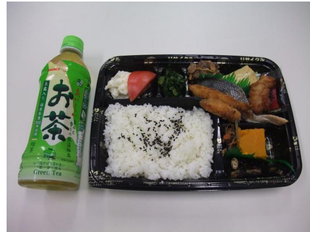
価格：700円(お茶付き) 販売個数：50セット