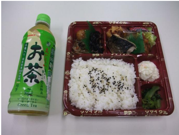
価格：500円(お茶付き) 販売個数：100セット

販売日：6月12日(火), 6月13日(水), 6月14日(木) 販売時間：11:30 ~ 13:30 (売り切れ次第終了) 販売場所：山口県教育会館 1F 受付付近